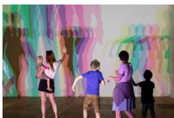
człowiek a przestrzeń***