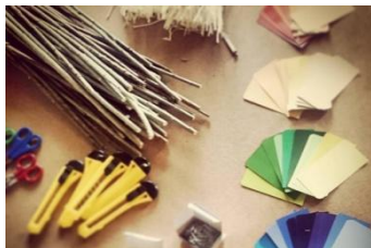
proste materiały i techniki