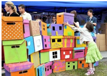
i zbudują naszą przyszłość!