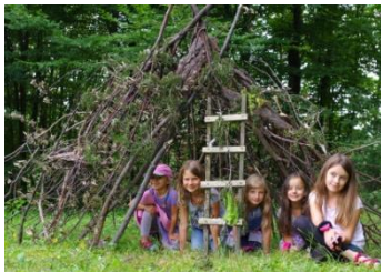
dzieci lubią budować...