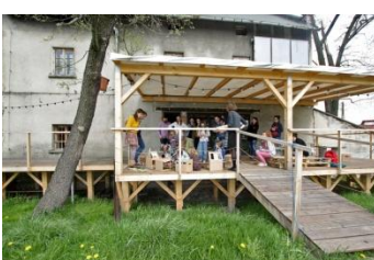
w przyjaznej przestrzeni miasta