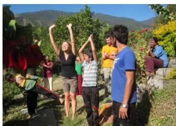
żywe konstrukcje >>> w zdrowym mieście zdrowi mieszkańcy!