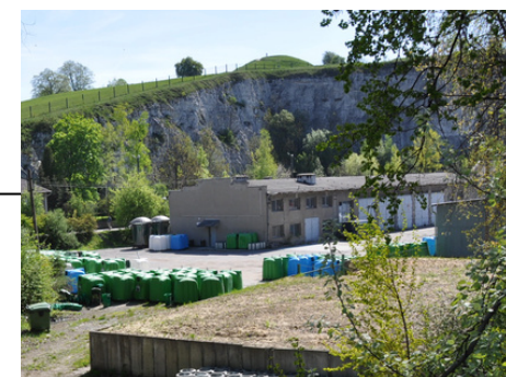
Budynki garażowo- warsztatowe