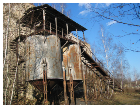
Silosy na koks