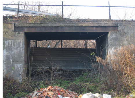
Wiadukt nad bocznicą kolejową