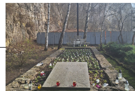
Zbiorowa mogiła ofiar Obozu Karnego „Liban”