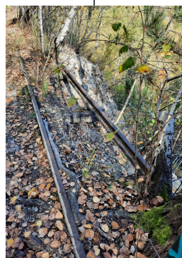
Fragment torów kolejki wąskotorowej