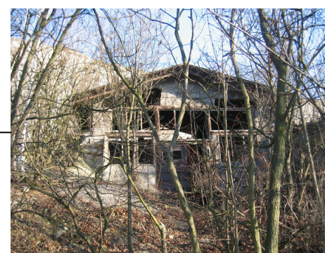
Magazyn prochu (laboratorium, biuro)