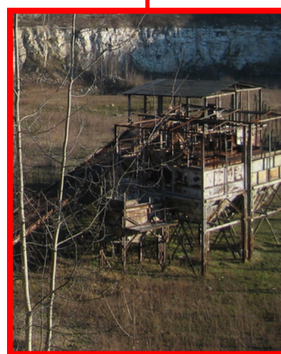
Przełożnik taśmowy i zbiorniki na wapno