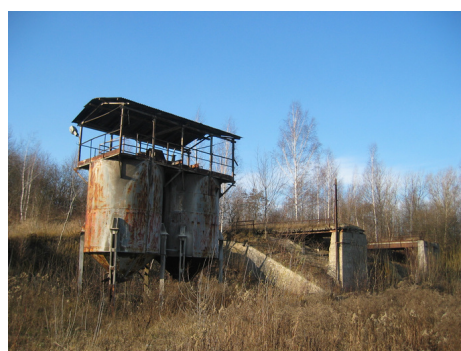
Fragment zakładu przeróbczego