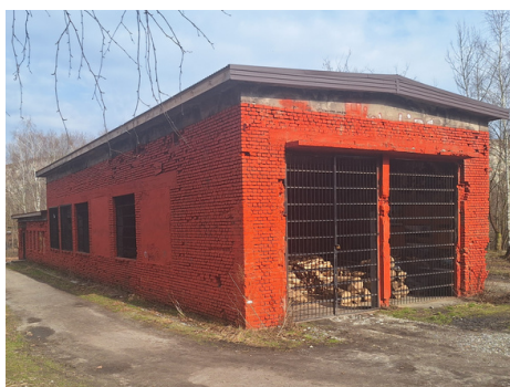
Remiza pojazdów kolejek wąskotorowych (warsztaty)