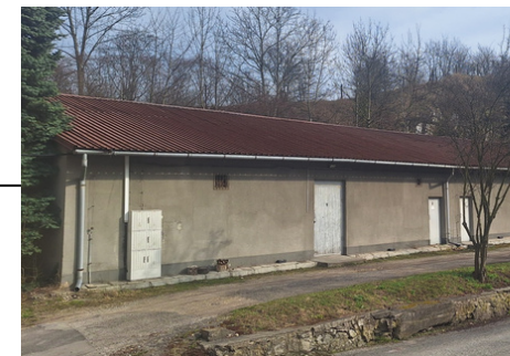
Magazyn/Lazaret i barak mieszkalny